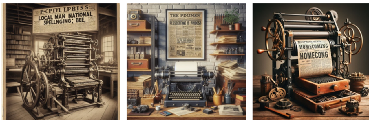
Figure 5. Une rhétorique du cadavre exquis

(figure 5), l'outil juxtapose les mots. Nul besoin n'est ici de passer par l'émotion pour observer qu'il ne produit pas une présentation, mais compose à partir de ses corpus, dans des mises en situation variées (un salon, un bureau, de très près). Les propositions, étonnantes, peuvent prêter à sourire par leur naïveté, mais aussi, fatiguer un utilisateur ayant une idée précise en tête, qu'il ne parviendrait pas à faire sortir en image à la machine. La scène est un cadavre exquis, superposant les termes du prompt , traduits au sens littéral dans une tentative de recontextualisation. Alors que, sur l'axe paradigmatique, il y a une concordance « à peu près » avec le texte en entrée, sur l'axe syntagmatique, les éléments sont réarrangés plus ou moins finement.